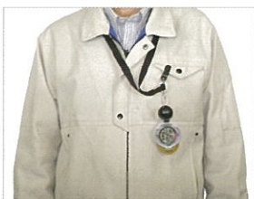
作業服の胸ポケットに取付け