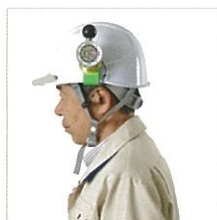
ヘルメットに取付け

特徴 5 ①カラビナ、②吊り下げ用アタッチメント、③ヘルメット取付用電池蓋、④三脚取付用電池蓋、⑤ネックストラップ、⑥ドライバー 付きでいろいろなスタイルで携帯可能